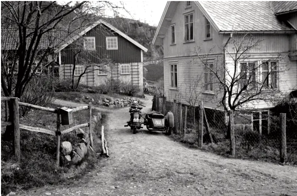
Hit til gården Helle ved Flekkefjord kom Gestapo og andre nazister ofte på besøk. De ante ikke at det ble sendt meldinger til England fra loftet.